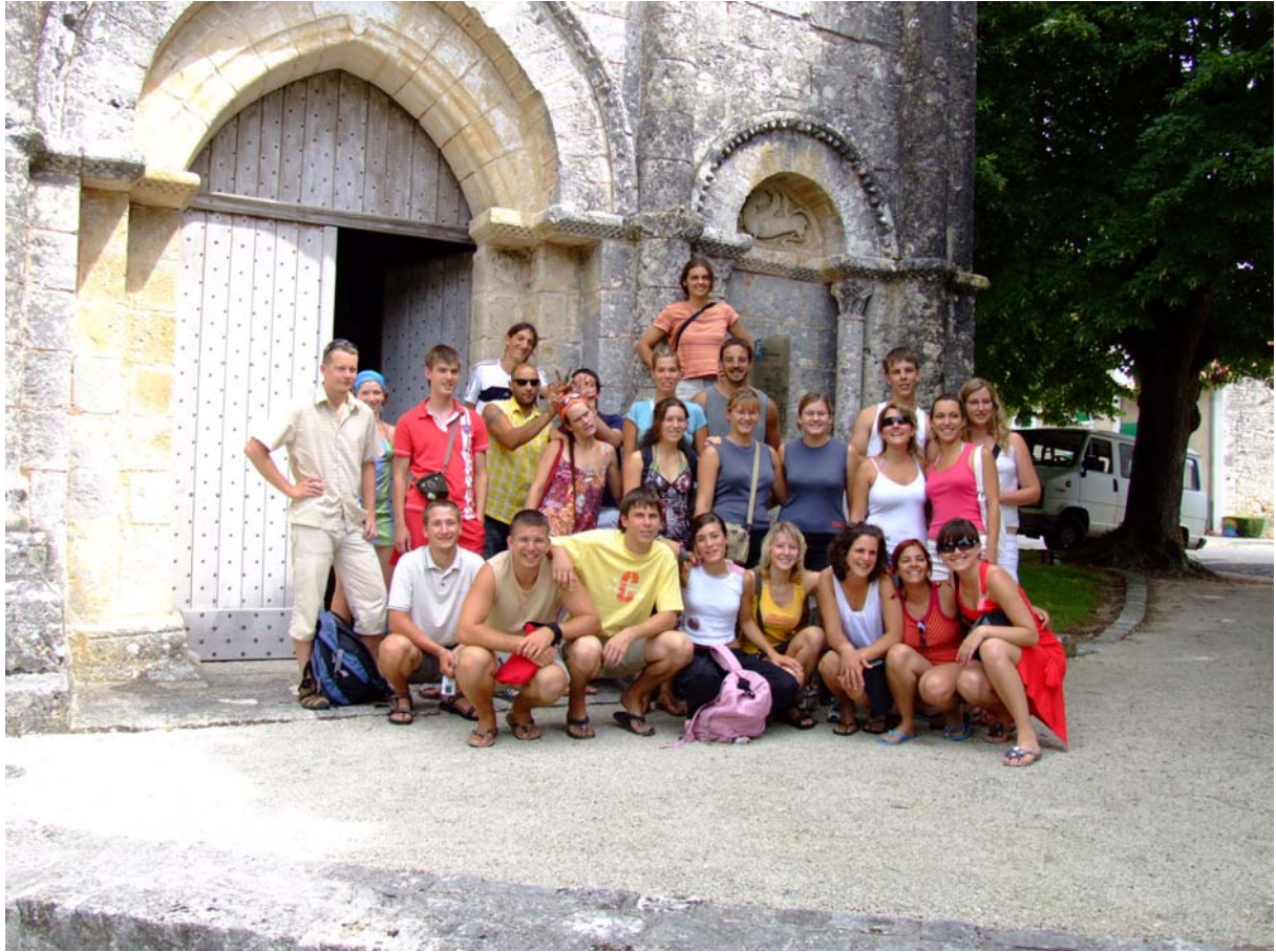
A tábor tagjai