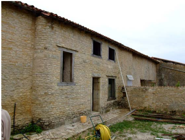
Chavagnac-i építési terület