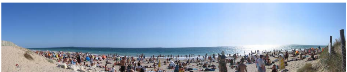
Ile de Re szigetén (Az óceán)