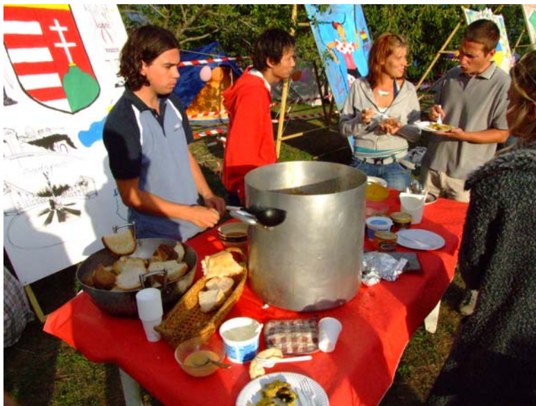
Európai Ifjúsági Party