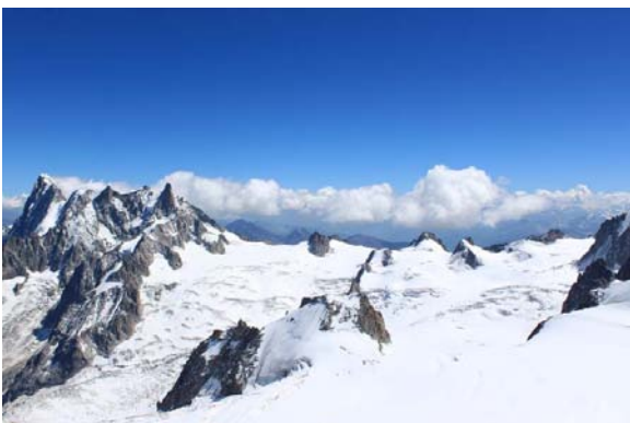
A Mont Blancnál