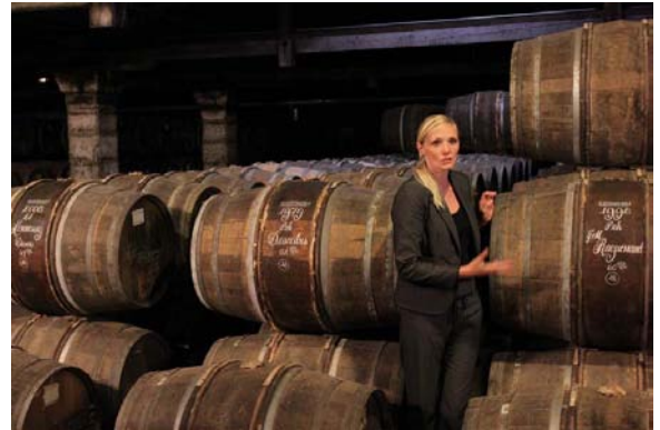
Hennessy konyakgyár (Cognacban)