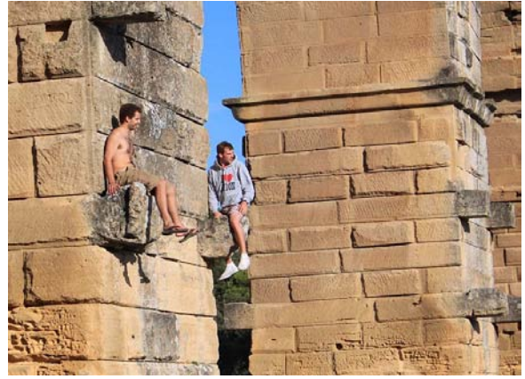
Pont du Gard