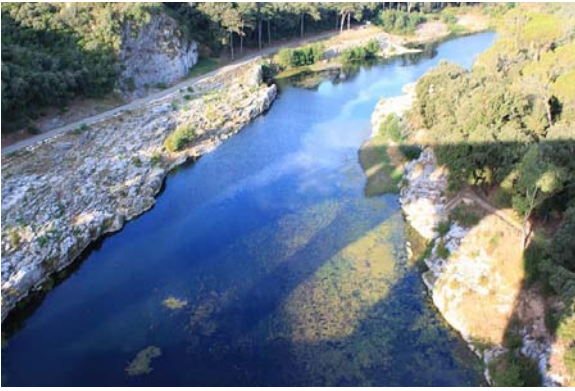
Pont du Gard