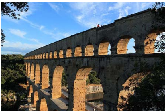
Pont du Gard