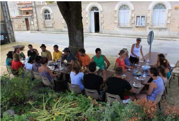
A Nanclars-i csapat