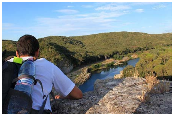
Pont du Gard