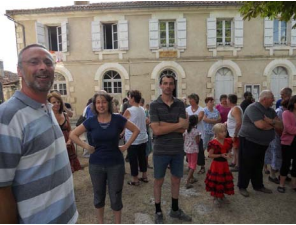
A polgármester, a falulakók, háttérben a szállás